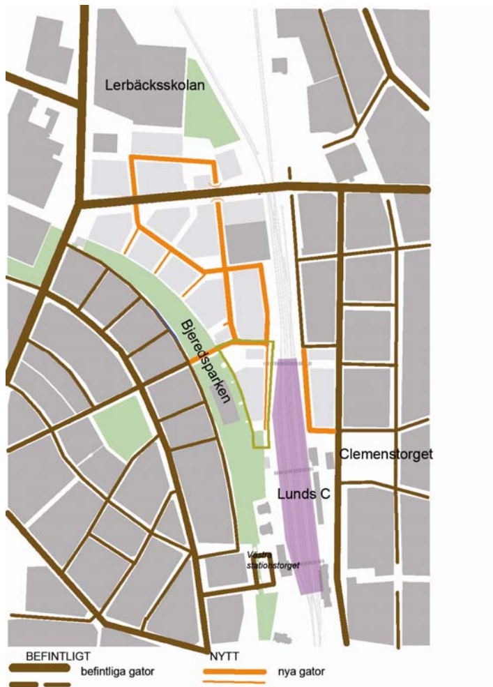
Befintliga och planerade gator i anslutning till kvarteret Kristallen