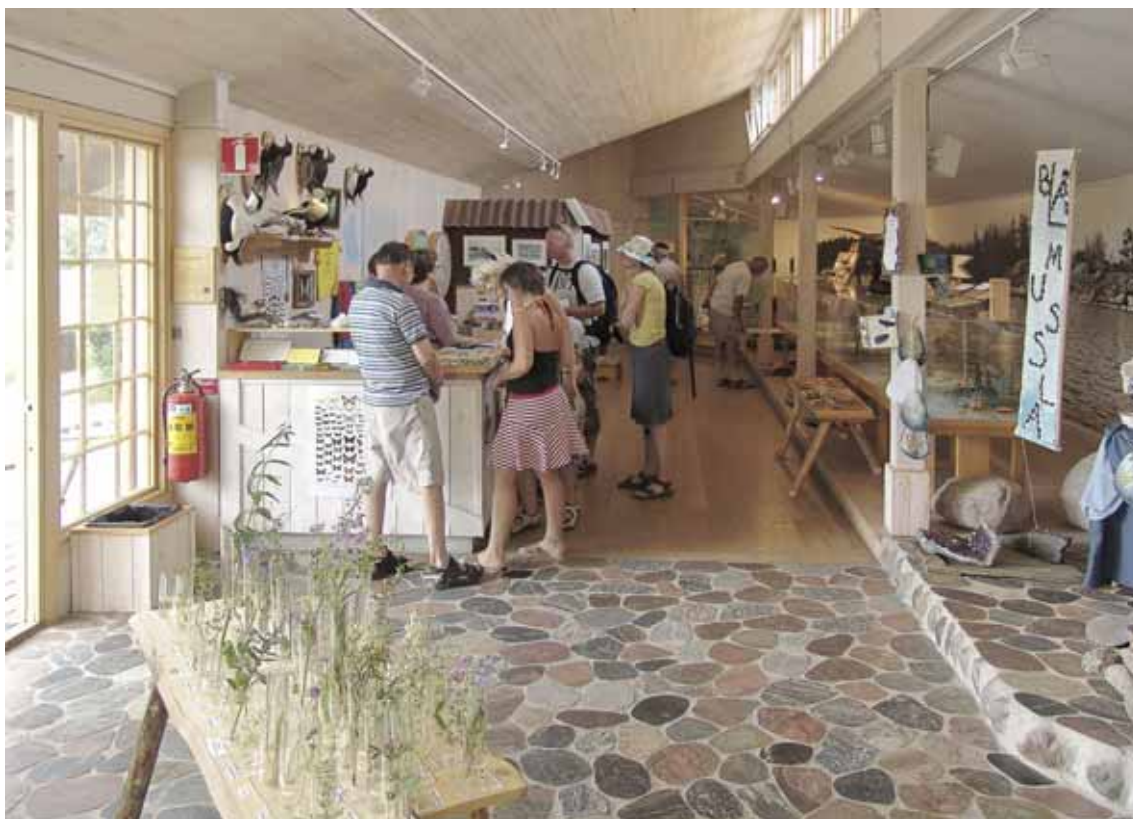
Entrén och del av utställningsrummet