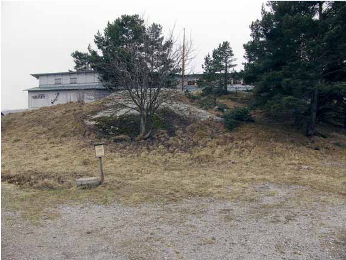
"Första glimten" av naturum från vägen och "HK-parkeringen"