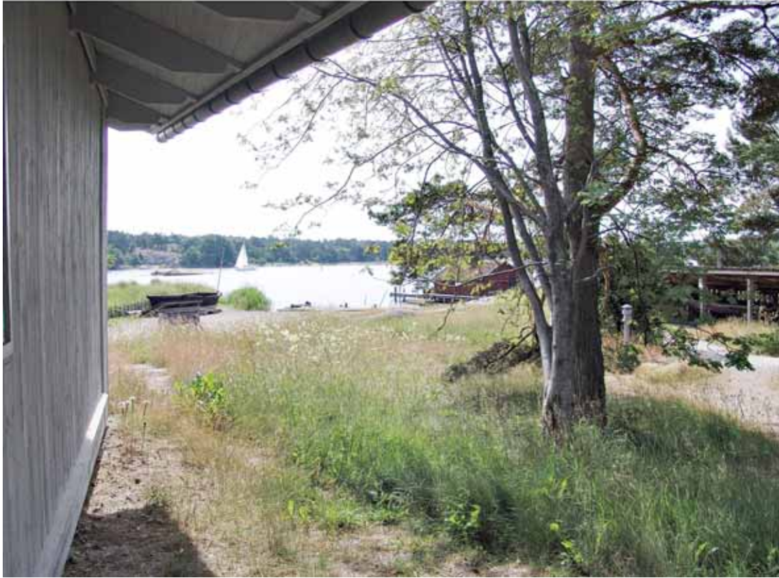
Utsikt österut från entrén