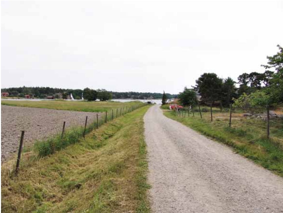
Från landsvägen syns naturum knappast ... (takets skymlar snett ovanför den röda bilen som står på HK-parkeringen)