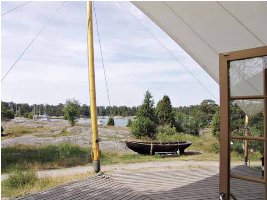
Utsikt söderut från entrén