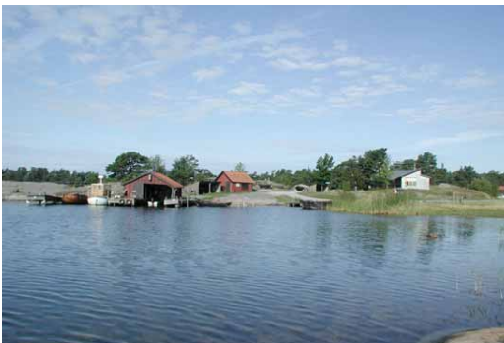
Aspnäset, Stendörren. Den befintliga naturumbyggnaden till höger i bild.