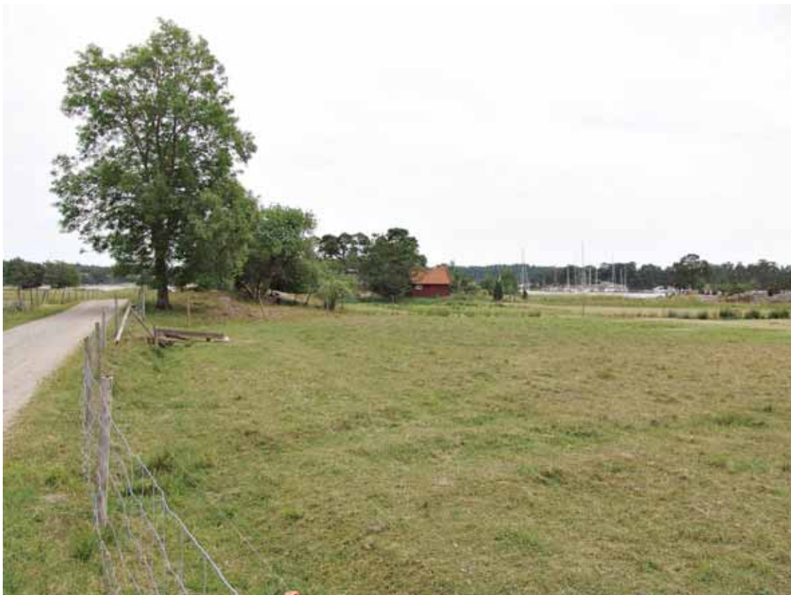
... eller inte alls. Tävlingsområdet mitt i bilden.