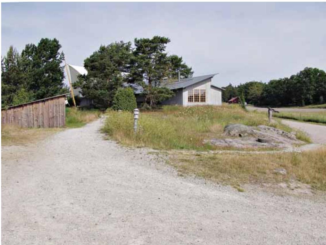
Naturum och gångvägen upp från "hamnplanen"