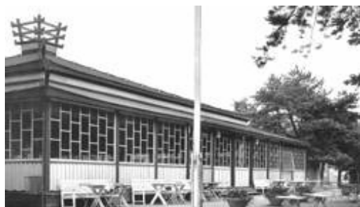
F d Strandbaden, vykort från 1930-40 (okänt ursprung)

Tävlingsuppgiften och dess förutsättningar beskrevs i ett tävlingsprogram som i korthet redogörs för nedan.