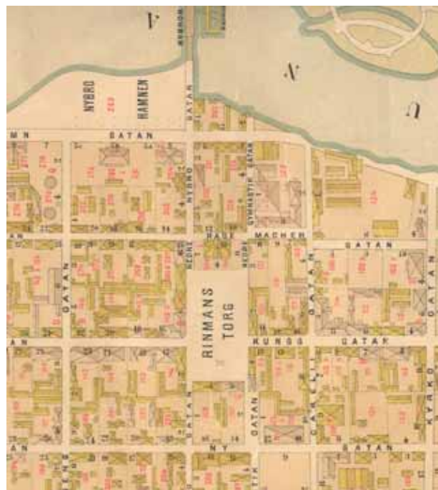
1890 års karta

Torget har sitt ursprung i Jean de la Vallés plan över Eskilstuna centrum från år 1658. Fristadstorget utlades som ett fyrkantigt torg med centriskt korsande gator och slutna hörn. Nuvarande Kungsgatan utgjorde axel i öst-västlig riktning. När sedan Nybrogatan placerades längs den västra sidan av torget försvann den ursprungliga tanken att förse torget med slutna hörn. Nybrogatan utgjorde en viktig gata nord-sydligriktning genom staden, med först färjeförbindelse och senare broförbindelse över ån.