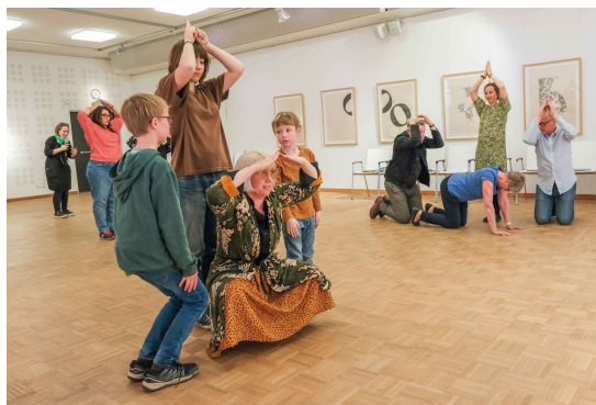
ARKITEKTURGYMNASTIK, Kenchiku Taiso på japanska, går ut på att man med kroppen försöker gestalta olika byggnader och konstruktioner. Här syns Lillåuddsbron, Västerås blivande resecentrum och Strömsholms slott!

Den 12 maj avslutades Arkitekturdagarna med prisutdelning hos Brf Notuddsparken på Öster Mälarstrand. Tyvärr kunde inte arkitekter och beställare närvara, men hade lämnat skriftliga och bildliga hälsningar. Bostadsrättsföreningen tog emot plakett och kryddväxter till odlingarna och firade sedan med korvgrillning.