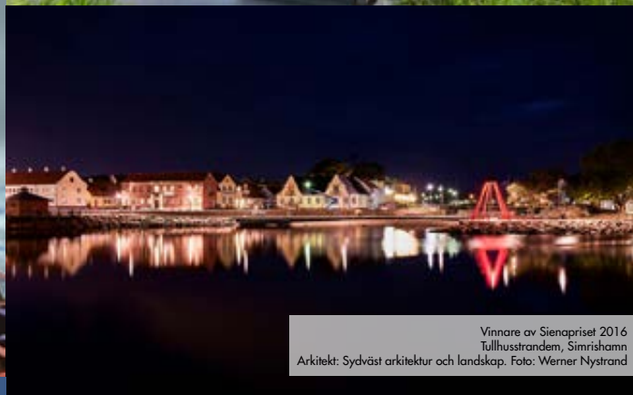
Vinnare av Sienapriset 2016 Tullhusstranden, Simrishamn Arkitekt: Sydväst arkitektur och landskap.