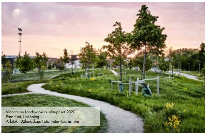
Vinnare av Landskapsarkitekturpriset 2020 Paradiset, Linköping Arkitekt: O2landskap.