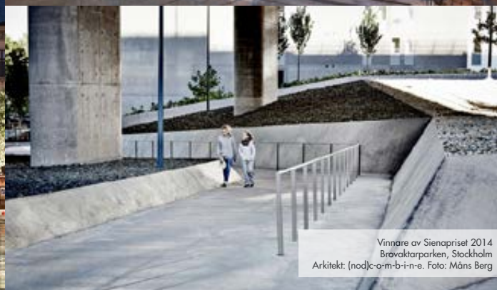
Vinnare av Sienapriset 2014 Brovaktarparken, Stockholm Arkitekt: (n)od|c-a-m-b-i-n-e.