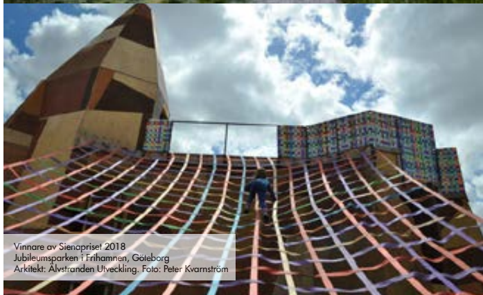
Vinnare av Sienapriset 2018 Jubileumparken i Frihamnen, Göteborg Arkitekt: Älvstranden Utveckling.