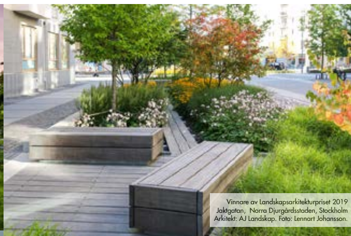
Vinnare av Landskapsarkitekturpriset 2019 Jaktgatan, Norra Djurgårdsstaden, Stockholm Arkitekt: AJ Landskap.