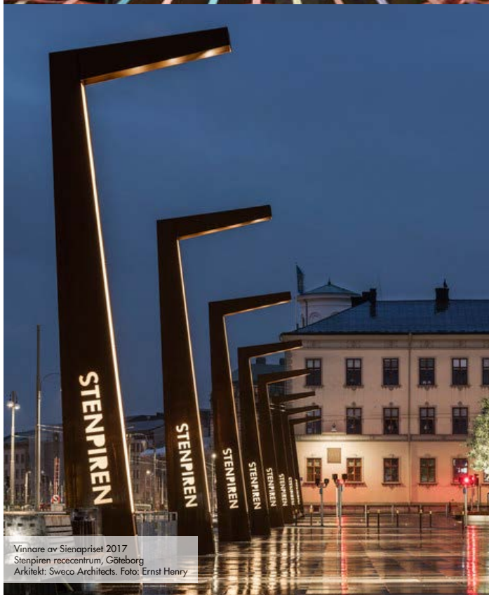
Vinnare av Sienapriset 2017 Stenpiren receentrum, Göteborg Arkitekt: Sweco Architects.