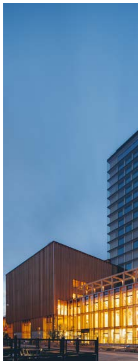
Sara kulturhus, Skellefteå Arkitektkontor: White arkitekter

Indexet rörande byggande, administrativa rutiner och lagefterlevnad omfattar åtta olika parametrar som poängsatts. Den maximala poängen som en kommun teoretiskt kunnat uppnå är 26 poäng, vilket skulle ha givit Index 100. Den högsta totalpoängen som uppnåtts är emellertid 20 poäng, vilket kommunerna Stockholm och Malmö når medan Karlstad och Örebro kommer på delad tredjeplats med 19 poäng.