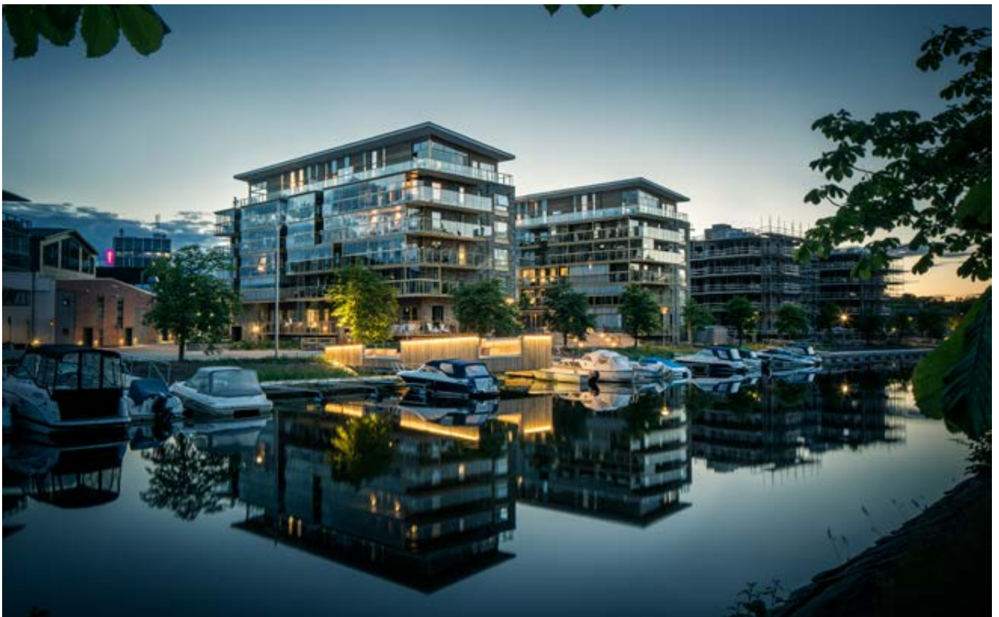
Karlstad, bostäder inre hamnen Arkitektkontor: Tengbom

För att uppmärksamma betydelsen av att kunna arbeta både med att möta bostadsbehovet och att samtidigt bygga en så attraktiv stad eller livsmiljö som möjligt med ambitioner för en minskad klimatpåverkan har HSB Riksförbund och Sveriges Arkitekter tagit fram ett index som mäter vilken kommun som arbetar bäst med dessa frågor. Arbetet med att ta fram underlag och genomföra undersökningen som utmärkelsen Årets Arkitekturkommun bygger på genomförs av det oberoende undersöknings- och analysföretaget Evimetrix på uppdrag av HSB Riksförbund och Sveriges Arkitekter.