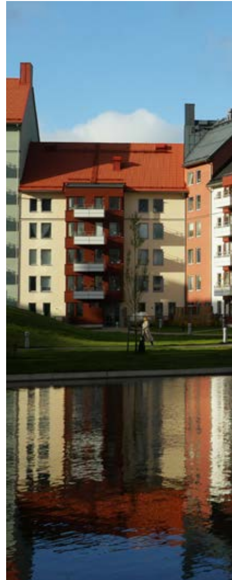
Mejeriområdet i Örebro