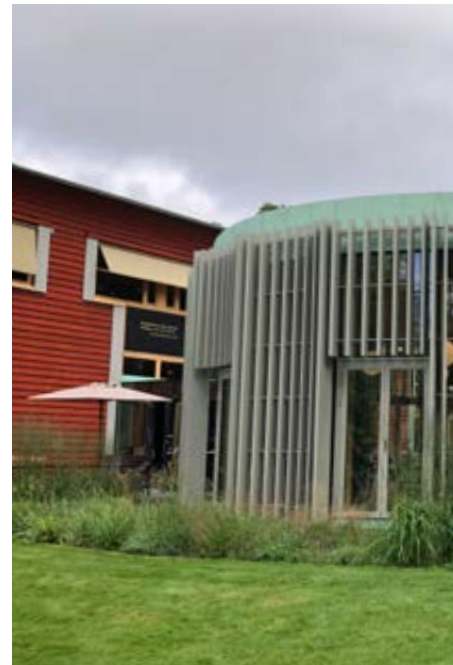
Värmlands museum, Karlstad

HSB Riksförbund, Sveriges Arkitekter och Evimetrix vill rikta ett särskilt tack till föreningen Klimatkommunerna för att vi ges tillåtelse att använda ovanstående uppgifter i bedömningen av Årets Arkitekturkommun.