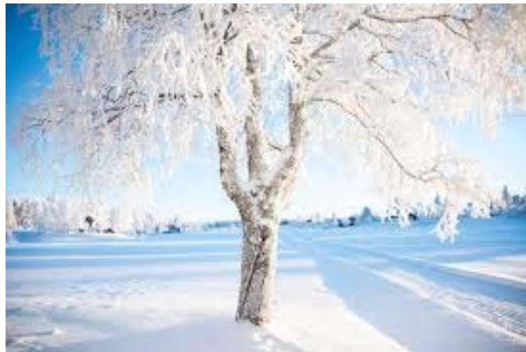
En inte alldeles vanlig Hallandsbild.

Dag: tisdagen den 9 februari Tid: 18.00 till ca. 20.00 Plats: Valfri — årsmötet är digitalt (se anvisning nedan)