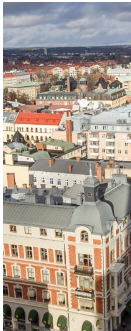
Flygbild över Örebro