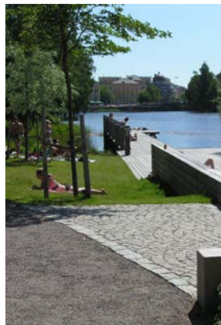
Bryggan i Karlstad

När det sedan blev tid att sammanställa årets resultat gick det inte att få fram relevanta och tillförlitliga data inom detta område. Detta berodde på att de kvaliteter som planerades ingå i utmärkelsen inte mättes i år. Därför tar inte utmärkelsen i år någon direkt hänsyn till dessa aspekter. Till kommande år kommer – i brist på tillräckligt kvalitativa offentligt tillgängliga data på området – denna typ av aspekter därför att inkluderas i enkätundersökningen som riktas till arkitektkåren.