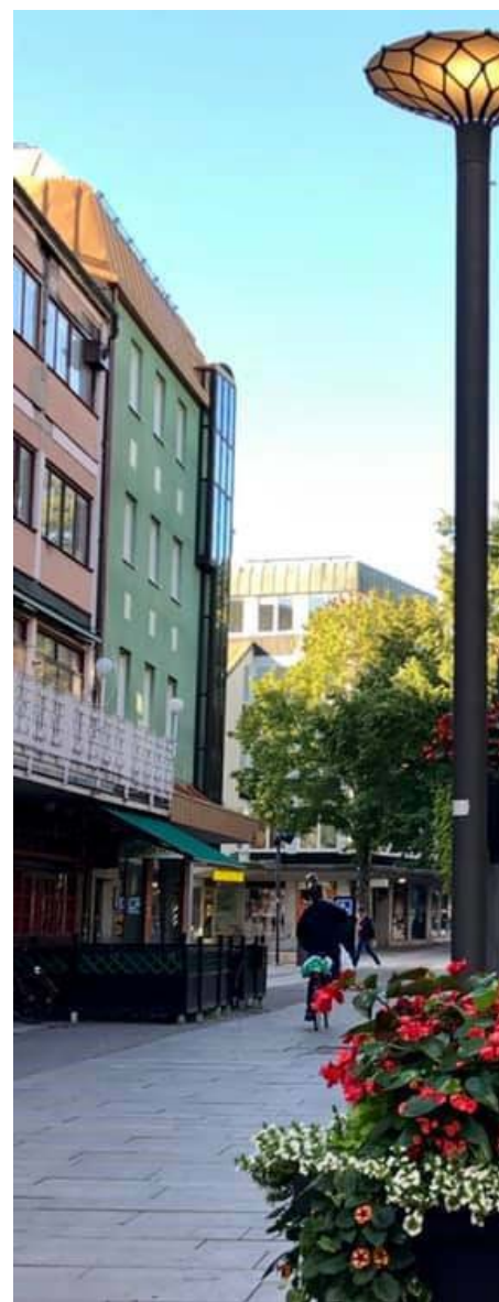
Gångstråk i Borlänge

Indexet rörande byggande, administrativa rutiner och lagefterlevnad omfattar sju olika parametrar som poängsatts. Den maximala poängen som en kommun teoretiskt kunnat uppnå är 24 poäng, vilket skulle ha givit index 100. Den högsta totalpoängen som uppnåtts är emellertid 18 poäng, vilket kommunerna Ekerö, Stockholm och Malmö når.