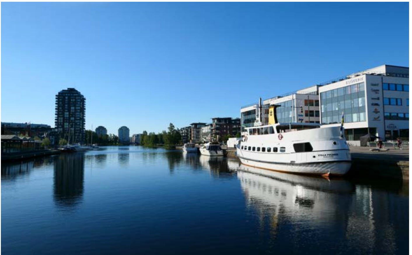
Karlstads inre hamn

För att uppmärksamma betydelsen av att kunna arbeta både med ett omfattande bostadsbyggande och att samtidigt bygga en så attraktiv stad eller livsmiljö som möjligt har HSB Riksförbund och Sveriges Arkitekter tagit fram ett index som mäter vilken kommun som arbetar bäst med dessa frågor. Arbetet med att ta fram underlag och genomföra undersökningen som utmärkelsen Årets arkitekturkommun bygger på genomförs av det oberoende undersöknings- och analysföretaget Evimetrix på uppdrag av HSB Riksförbund och Sveriges Arkitekter.