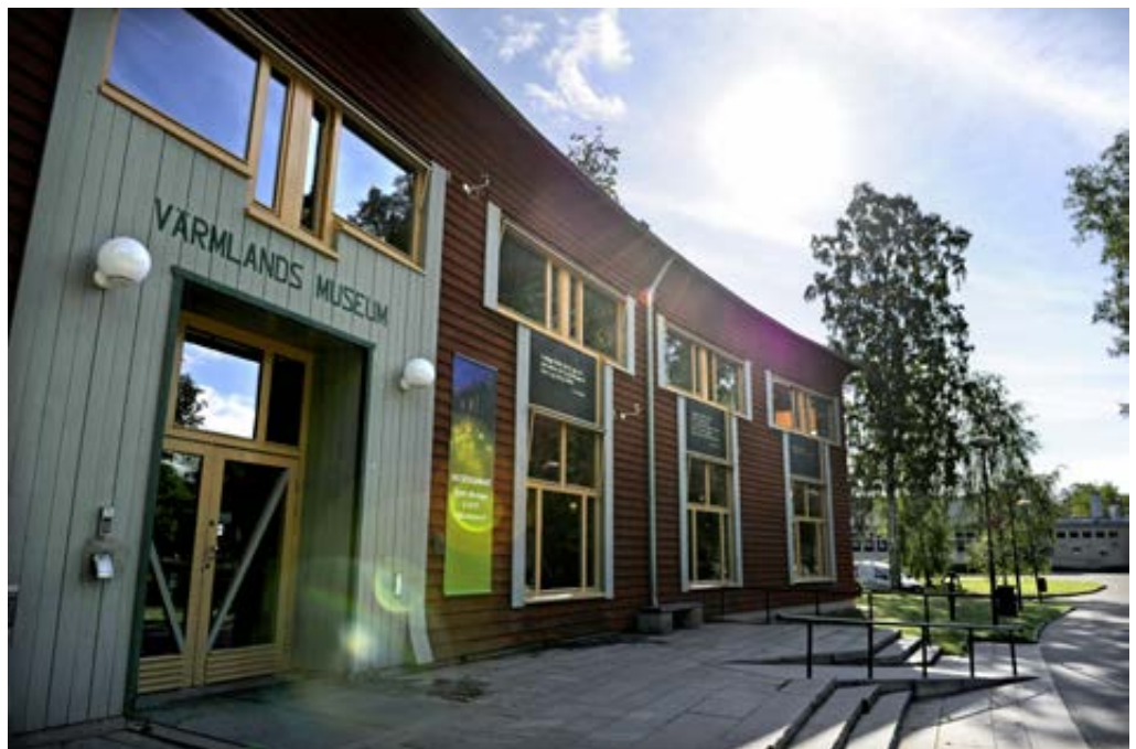
Värmlands museum, Karlstad

En intressant regional observation är att fem kommuner i Skåne och Blekinge placerar sig på topp 20 i år. Fyra kommuner i Stockholms län placerar sig på topp 20 och ett par kommuner i Östergötland samt kring Mälaren och Hjälmaren återfinns på listan. Även kommuner norr om Mälardalen återfinns på topp 20. Det som emellertid är slående är att endast Borås i Västra Götaland återfinns på listan och att inga kommuner i eller kring Storgöteborg eller i Halland finns med. Mölndal, Partille, Skövde, Falkenberg och Ulricehamn har varit på topp 20 ett eller två år men inte i år; nu är endast Borås representant för Västsverige.