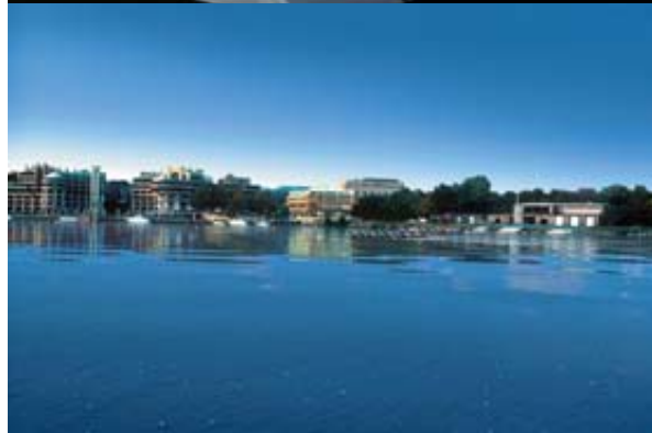
Sveriges nya Washingtonambassad, mellan Potomac River och Rock Creek. Så här vill Wingårdhs att vi ska se den, på nära håll och distans.