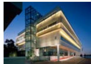
House of Sweden i Washington. Inbjuden tävling 2003. Kasper Salin-pris 2007. Wingårdhs genom arkitekter SAR/MSA Gert Wingårdh och Tomas Hansen.

Sveriges Arkitekters tävlings- och upphandlingsservice omfattar allt från hjälp med programskrivning till att planera goda processer, säkerställa kvalificerad bedömning samt ansvara för dokumentation.