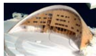
Vinnande förslag i tvåstegstävling om ny byggnad för sametinget i Kiruna. Murman arkitekter genom arkitekter SAR/MSA Hans Murman och Helena Andersson.

Baksida: Detaljbild från Citadellbadet, Landskrona. Nominerad till Kasper Salin-priset 2007 (ej pristagare). Wingårdh Arkitektkontor genom arkitekt SAR/MSA Gert Wingårdh m.fl.