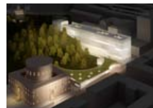
Vinnande förslag i tävlingen om Stockholms stadsbibliotek. Heike Hanada, Tyskland.

Till vänster: Sveriges Arkitekter biträde Stockholms stad i tävlingen om Stockholms stadsbibliotek, som blev en av de största i världen. Bilden är från upppackningen av de närmare 1200 förslagen. All information, allt underlagsmaterial och alla förslag publicerades på Sveriges Arkitekters webbplats www.arkitekt.se/asplund .