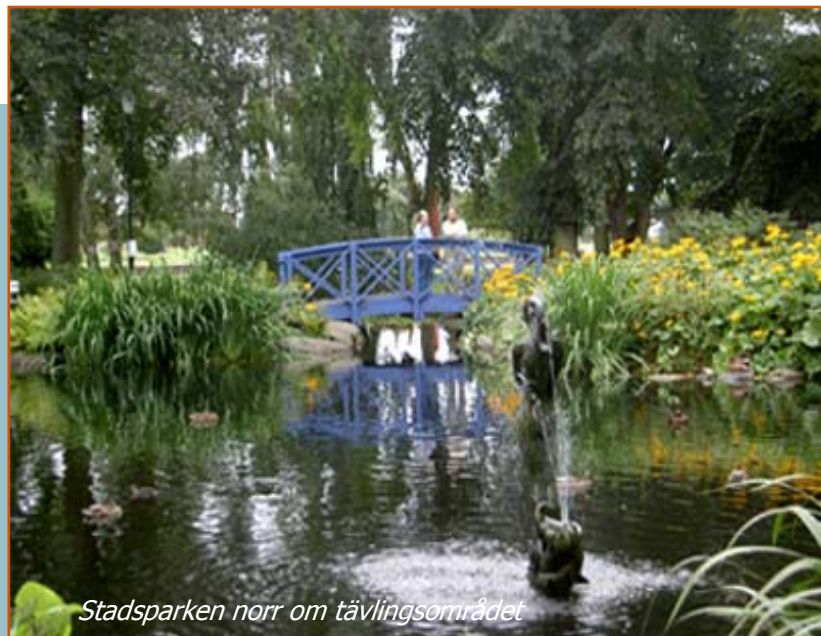
Stadsparken norr om tävlingsområdet