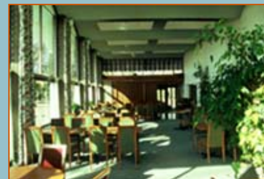
Byttan, matsalen mot entrén, foto Rolf Lind

Samtliga förslagsställare innehar upphovsrätten och behåller nyttjanderätten till sina förslag. Direkt utnyttjande av förslag, helt eller i väsentliga delar, kan ske först efter avtal med förslagsställaren.