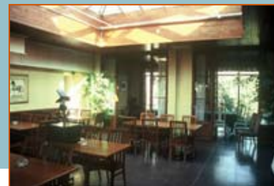
Byttan, klubbrummen mot norr